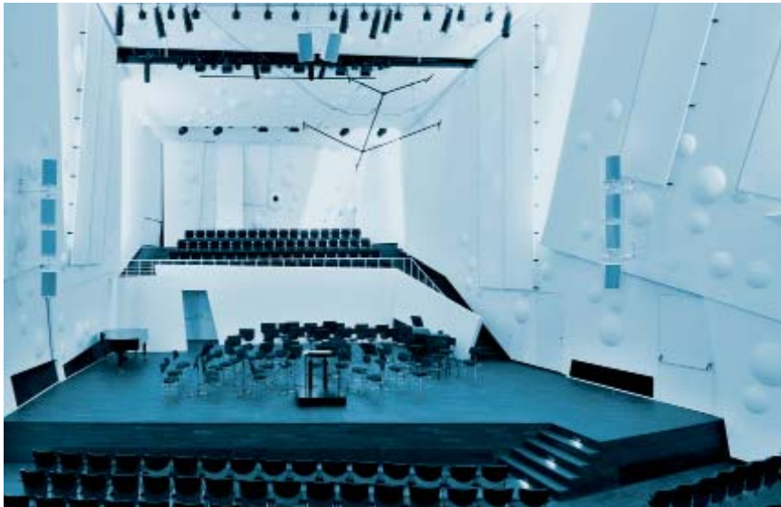
Konzertsaal der HfM Dresden